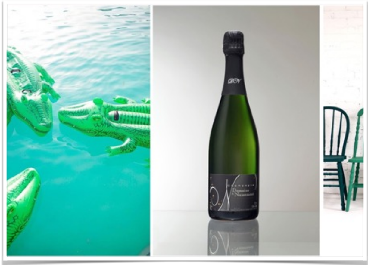
Cuvée Classique DN, 21 euros TTC

De ses coteaux où grandissent et poussent ses vignes au fil des saisons jusqu'à l'élaboration de son Champagne, DN "le Classique" est une succession d'un savoir-faire. Un assemblage 100% Pinot Noir. De son terroir, de l'expérience des hommes et des femmes qui sculptent les sillons et tracent ainsi sa destinée, Champagne DN prend sa force de la nature, et propose une véritable harmonie. Son terroir lui donne un penchant masculin, la courbe de ses bulles lui donnent des facettes féminines.