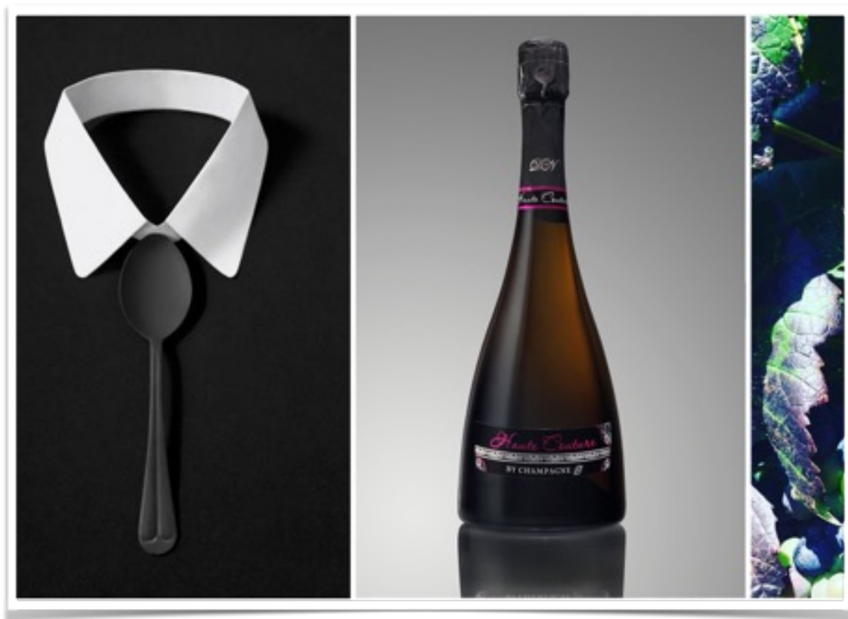
Cuvée Haute Couture, 45 € TTC

Elle est baptisée "Haute Couture" reçoit toutes les attentions particulières mises en œuvre dans son élaboration. C'est le paradoxe de la nuit qui renferme le jour comme un talisman. elle est aussi le lien entre une petite robe noire qui sculpte le corps d'une femme et révèle ses courbes voluptueuses. Elle a du caractère, de l'allure, et de l'attitude. Une Cuvée Prestige "Haute Couture" qui se veut l'expression de la quintessence du chic. La touche de rose comme un fil rouge, reste la signature du Domaine de Nuisement.