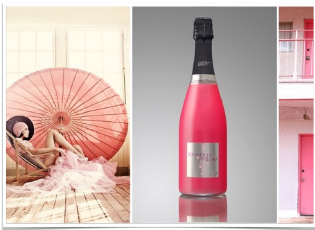
Cuvée Merveille de Rosé DN, 29 euros TTC

Oubliez la mythique « panthère rose » et les romans « à l'eau de rose » de Barbara Cartland. Oubliez aussi toutes les nuances de roses : bisque, carnation, carné, chair, coquille d'œuf, cuisse de nymphe émue, pêche, rose dragée, vieux rose, capucine, fuchsia, grenadine, héliotrope, nacarat, pelure d'oignon, rose balais, rose bonbon, rose thé, rose vif, fraise, fraise écrasée, framboise, lilas, saumon malabar et tagada. Notre rose est unique comme notre champagne. Il adopte une couleur à la référence symbole de l'amour.